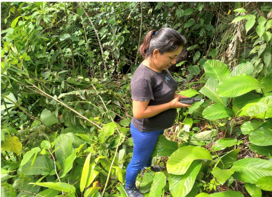
Figura 7. Georeferenciación de la parcela de estudio del sistema bosque secundario.