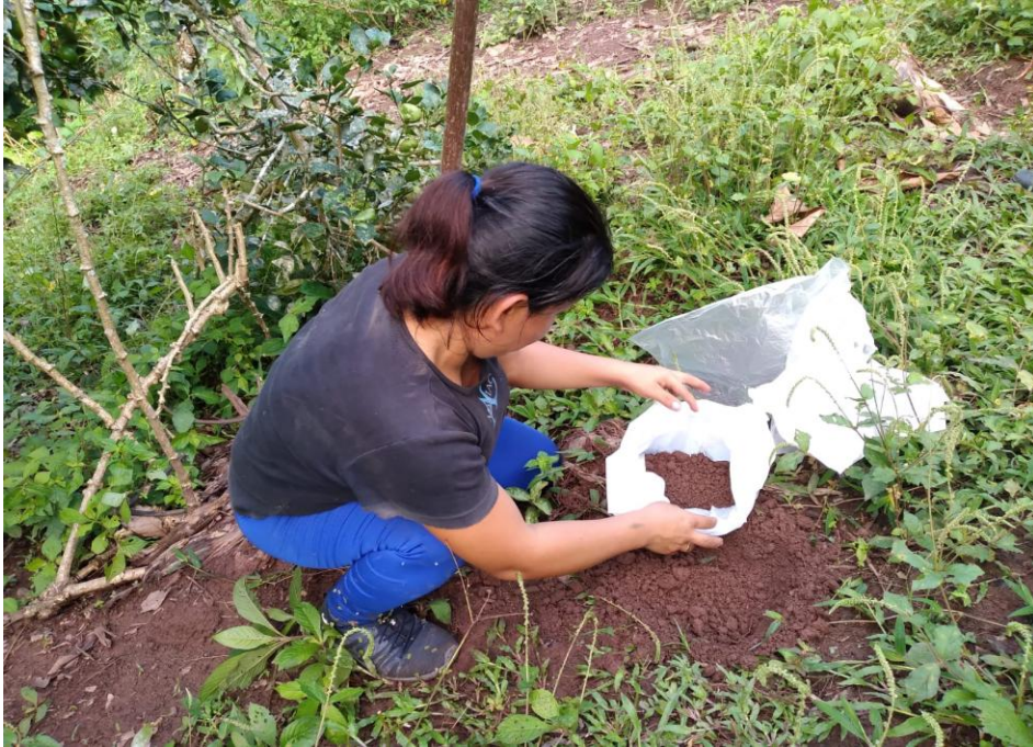
Figura 6. Recolección de muestras de suelo en el sistema SAF/cítricos.