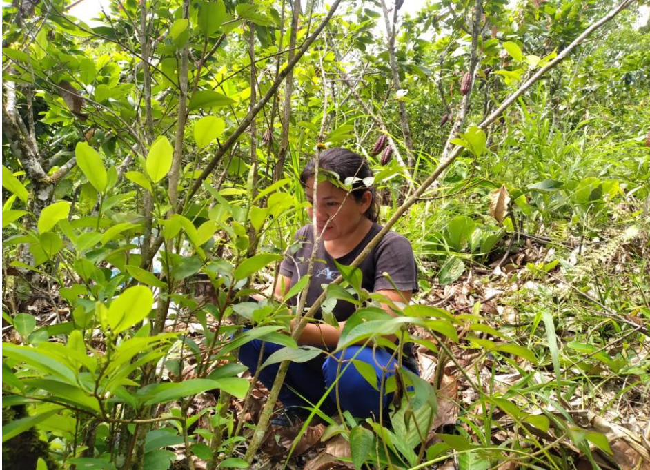
Figura 8. Recopilando datos de las parcelas de estudio, sistema ex cocal.