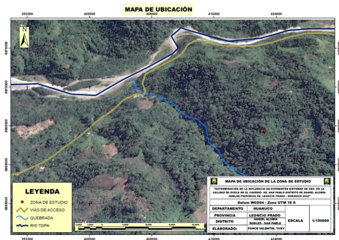
Figura 1. Mapa de Ubicación

Sin embargo, el propietario comentó que, en los años de 1970, fue como peón a dicho caserío, y en los años 70 necesitaban pobladores constantes con visión de formar un caserío, mediante el posicionamiento de tierras adquiridas dimensiones de terreno. En ese año se ha posicionado con dictamen escrito por las autoridades mediante un acta, encontrando el terreno cultivado aproximadamente 02 ha, esa limpieza lo realizó el posicionado anterior y finalmente abandonó por motivos de terrorismo que constantemente realizan intimidación, así como la fuerza armada, al final el posicionado anterior nunca volvió.