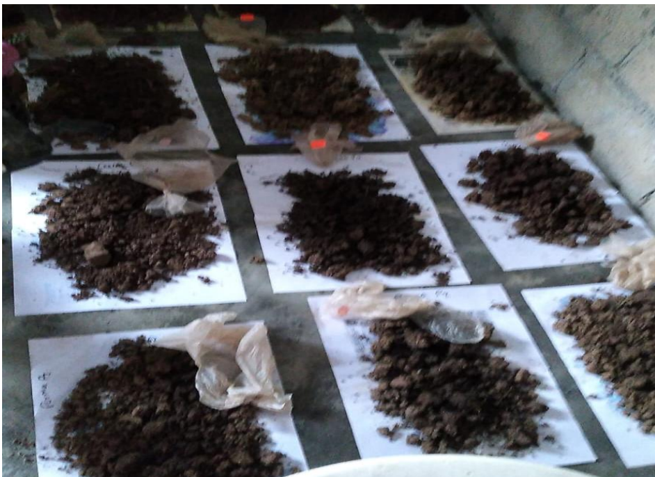
Figura 9. Secado de muestras de suelo.