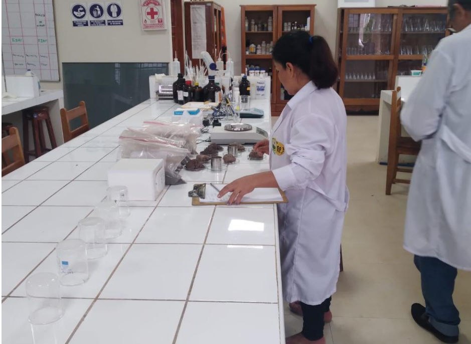
Figura 10. Pesado de muestras de densidad en el laboratorio de la Universidad Nacional Agraria de la Selva.