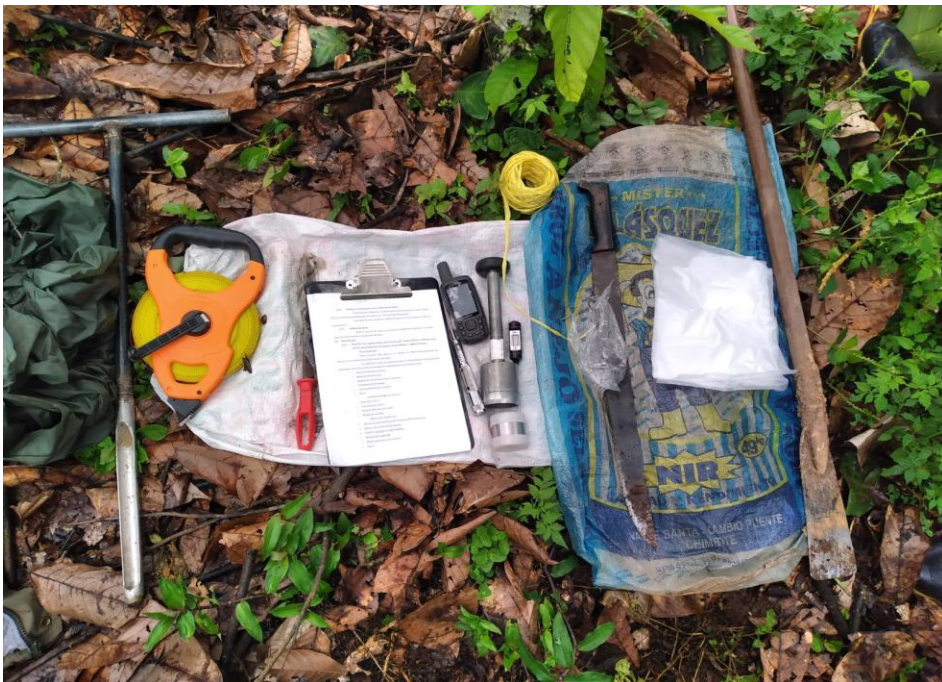
Figura 5. Equipos e instrumentos de medición del estudio.