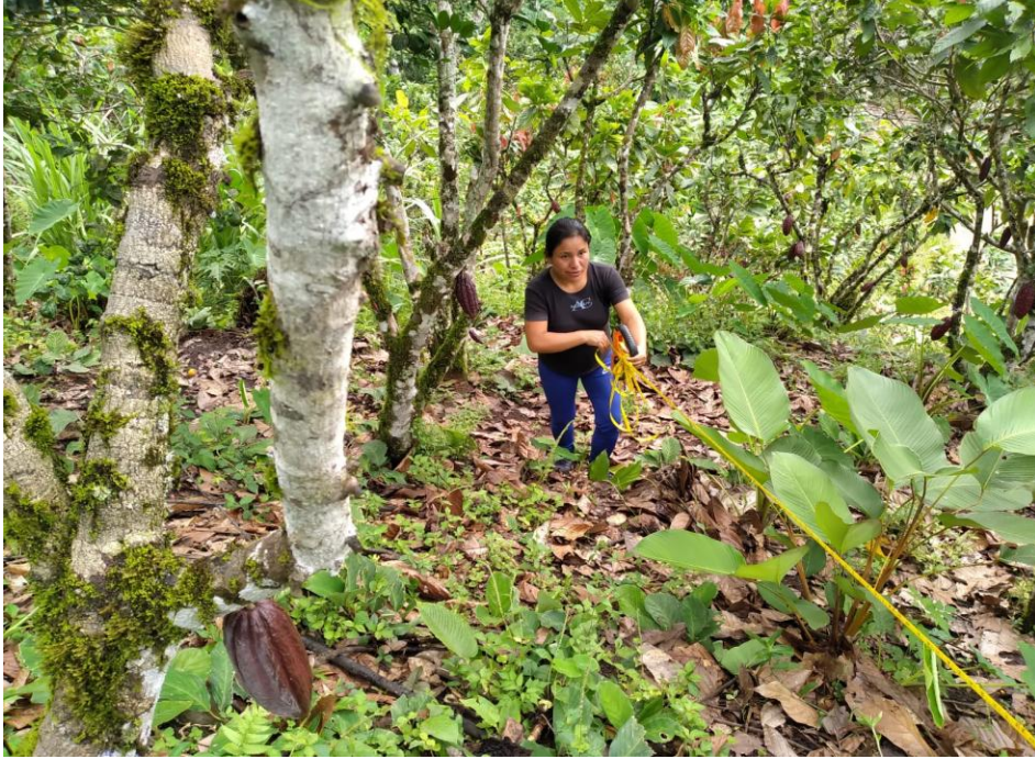
Figura 4. Ubicación, medición de la parcela de estudio en el sistema cacao.