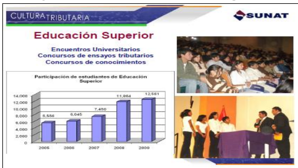
Figura N° 3. Cultura Tributaria en Educación Superior