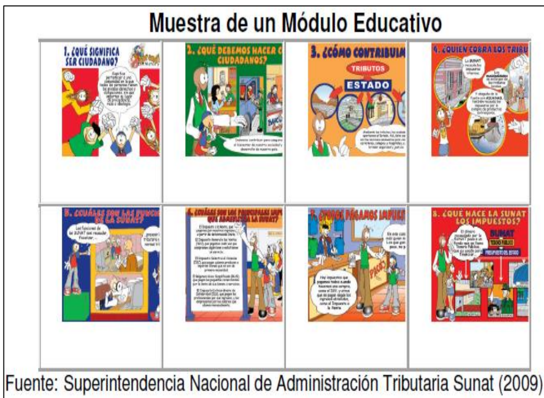
Figura N° 4.

(Rodrigo, 2015), expresa que el objetivo de la Cultura Tributaria es que los estudiantes se instruyan para mejorar una mayor Recaudación Tributaria y que no sigan cometiendo delitos intencionados por aquellos contribuyentes que están obligados a declarar y obtener una mejora económica creciente. Así mismo se Concluye que la Cultura Tributaria es una influencia positiva, en comportamiento del ciudadano y que ayuda a la formación de valores, actitudes y a la transmisión de conocimientos tributarios y así aumentar la recaudación fiscal. Una de las estrategias es la implementación de los programas de educación tributaria; estos están comprendidos como los seminarios, los talleres, las campañas. Su único fin es de reducir el incumplimiento de las obligaciones tributarias y generar mayor conciencia tributaria.