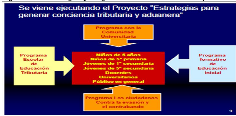
Figura N° 2 Estrategias para generar conciencia tributaria y aduanera

También menciona que ha de existir una conducta errónea o adversa hacia el pago de los impuestos e incluso en cumplimiento de las obligaciones tributaria, para ello la Conciencia Tributaria es uno de los pilares fundamentales porque es la motivación a pagar los impuestos, refiriéndose a las actitudes y creencias de las personas. La educación cívica tributaria ha generado la implementación de cierta cantidad de proyectos educativos en colaboración con el MINEDU, garantizando una mayor Conciencia Tributaria y promoviendo el cumplimiento voluntario de las obligaciones tributarias, por lo cual consideran a la educación el medio eficaz para la formación de valores como se muestra en la figura N° 2.